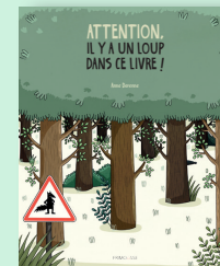
Attention, il y a un loup dans ce livre ! A. Derenne