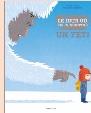
Le jour où j'ai rencontré un yéti C. Claire & S. Chebret