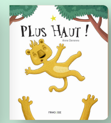
Plus haut ! A. Derenne